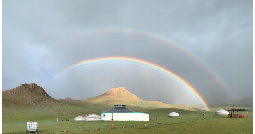
구름과 산그늘 아래는 시원한 여름 변화무쌍한 몽골의 날씨는 한여름에도 눈이 내리고 우박이 떨어집니다. 바다같은 호수에서 풍랑이 일고 무지개가 뜹니다.